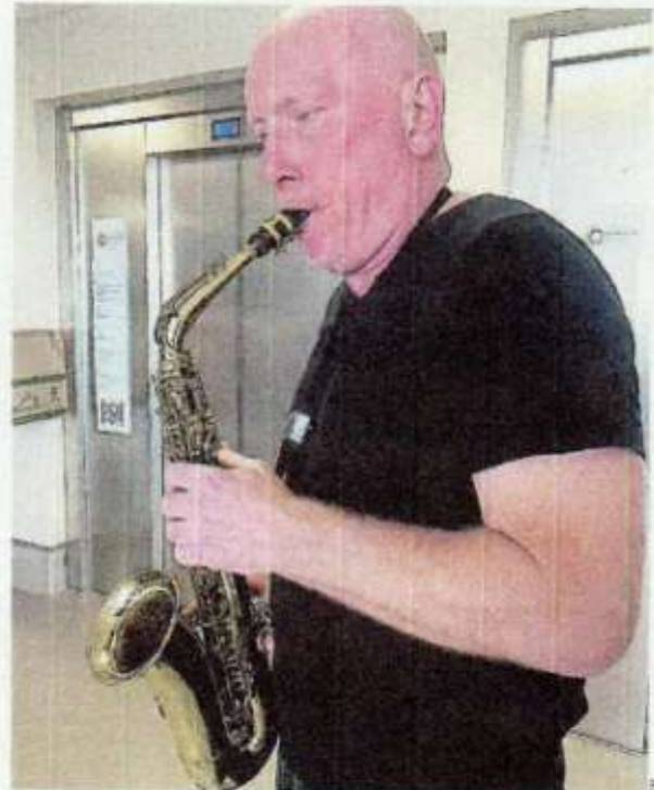
En laiton, en cuivre ou en plastique, le saxophone appartient à la famille des bois.

Du vendredi 21 au dimanche 23 avril , école municipale de musique des Renaudières. Saxo et piano, vendredi et samedi. Remise des prix, dimanche, à 15 h, avec