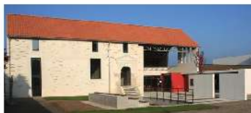
Ecole Municipale de Musique Les Renaudières 44470 Carquefou